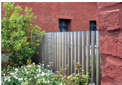
Clôture en bois qui se patine avec le temps.

→ Privilégier les matériaux bruts qui se patinent avec le temps et sont plus authentiques (sauf pour les matériaux destinés à être enduits).