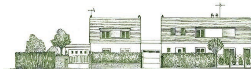
Schéma d'ambiance en secteur intermédiaire.

Il se caractérise par des espaces bâtis à dominante résidentielle , où le végétal et la perception des jardins sont prédominants. Dans ce secteur, une cohérence paysagère est recherchée.