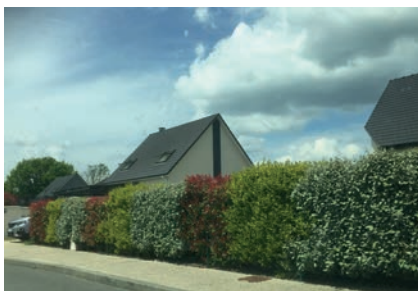
Haie de charmille taillée en limite d'espace public.