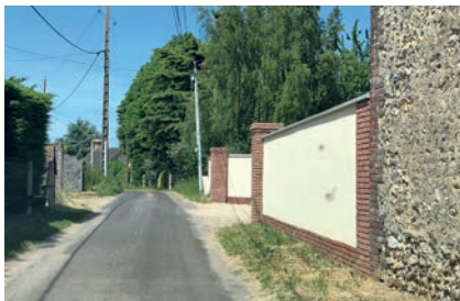
Mur plus classique (parpaings enduits avec sous-bassement et piliers en briques) qui s'inspire des teintes des matériaux traditionnels.

→ Privilégier les matériaux bruts qui se patinent avec le temps et sont plus authentiques (sauf pour les matériaux destinés à être enduits).