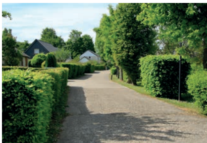
Haie de charmille taillée en limite d'espace public.